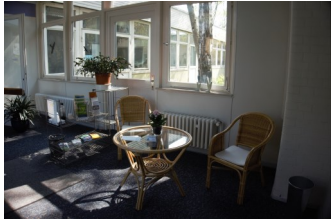
Wartezimmer im GEMI