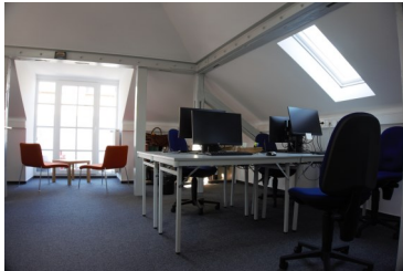
Vorbereitungsraum für Therapeut_innen